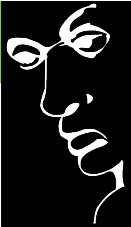
Hay una cara... y la palabra "Liar"

INDICA SI LAS LÍNEAS ENTRE LOS BLOQUES NEGROS SON HORIZONTALES Y PARALELAS.