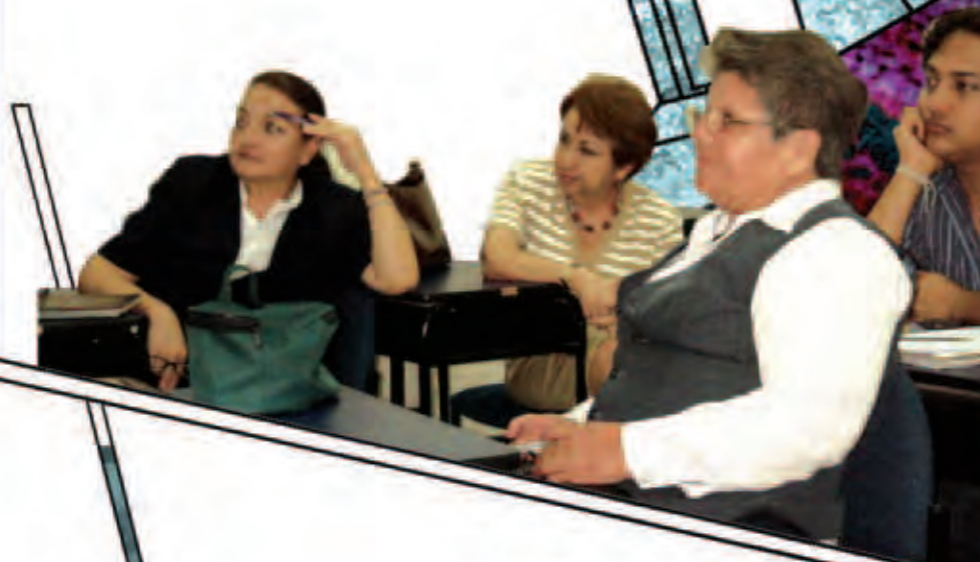
Saludamos y agradecemos la confianza de la M.I. Municipalidad en nuestra institución.

El proceso a continuación es la revisión, levantamiento e incorporación de sugerencias y validación de los productos ya elaborados y que quedaron pendientes, cuya realización es competencia del Directorio de la Mesa Cantonal.